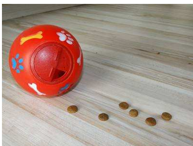
snackball czyli kula-smakula

Zabawki, w których można dodatkowo ukryć smakołyki/wypełnić karmą z puszki: