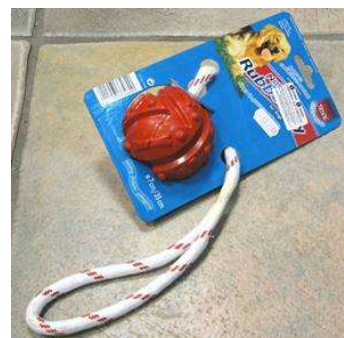
piłki do aportowania, zarówno z lądu jak i z wody

Możemy bawić się z psem w przeciąganie, aportowanie, wspólne gonitwy, należy jednak pamiętać o pewnych regułach: