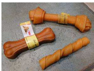
kości ze skóry