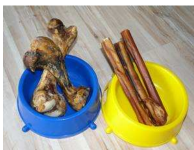
kości i penisy wołowe