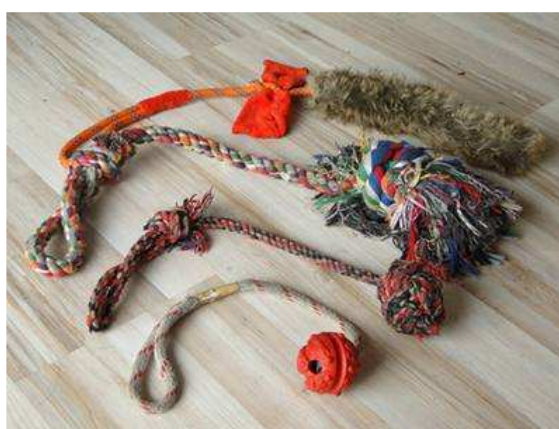
szarpaki do wspólnego przeciągania