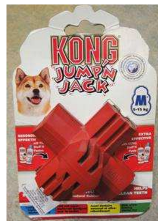
tradycyjny kong i inne zabawki z otworami do wypełnienia jedzeniem

Zabawka typu kong jest jedną z najtrwalszych zabawek na rynku (zwłaszcza jej czarna odmiana), świetnie nadaje się dla wszystkich psów, nawet tych o bardzo silnych szczękach. Wypełniając kong, najlepiej wrzucić kilka suchych smakołyków, a ostatni brzuszek wypełnić czymś o konsystencji pasztetu, może to być np. zmielone mięso, karma z puszki czy też specjalna pasta do kupienia w sklepach zoologicznych. Taka zabawka zajmie psa na dłuższy czas, pomoże mu się wyciszyć i skupić na zadaniu.